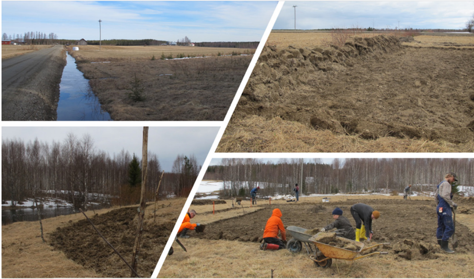
Kuva 1. Toukokuun alku vuonna 2021. Rasimäen maalaismaisemaa (vasen yläkuva). Opiskelijat perustamassa kasvimaata (oikea ylä- ja alakuva). Rumojoki, josta kasvimaan kasteluvesi kannetaan kasveille (vasen alakuva).

Figure 1. The beginning of May 2021. Rural landscape in Rasimäki (upper left). Students founding the vegetable garden (upper and lower right). Rumo river, where the irrigation water is carried to the plants (lower left).