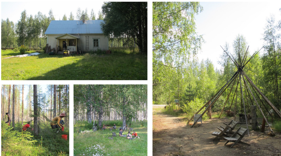
Kuva 4. Heinäkuun loppu 2021. Repokankaan pientilan päärakennus, jossa monet vierailevat opettajat majoittuivat (vasen yläkuva). Marjojen poimintaa ja rentoutumista työpäivän päätteeksi (vasemmat alakuvat). Päivittäisen aamupiirin kokoontumispaikka, jossa päivän tuntemukset ja ohjelma käytiin kesäaikaan läpi (oikea kuva).

Figure 3. The beginning of May 2021. The main building of Peltola (upper left). The main building of Rumola (upper right). Rumola property's buildings (lower left). Peltola property's storage and dry toilet, behind the most common modes of transportation (lower right).