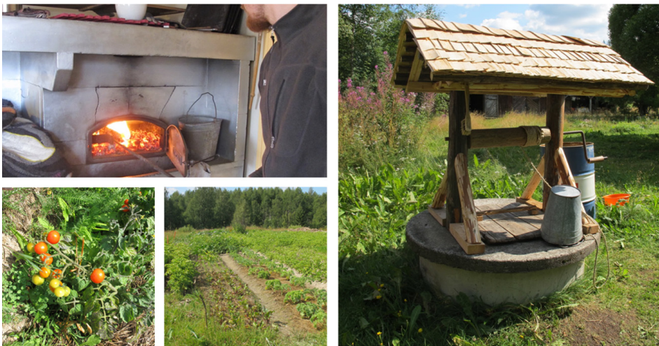
Kuva 2. Heinäkuun loppu 2021. Opiskelija lämmittää leivinuunia ruisleivän paistamista varten (vasen yläkuva). Kasvimaan kukoistusta (alakuvat vasemmalla). Peltolan pihakaivo ja sen ylle rakennettu suojakatos ja vinski (kuva oikealla).

Figure 1. The beginning of May 2021. Rural landscape in Rasimäki (upper left). Students founding the vegetable garden (upper and lower right). Rumo river, where the irrigation water is carried to the plants (lower left).