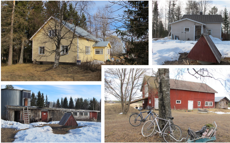
Kuva 3. Toukokuun alku 2021. Peltolan pientilan päärakennus (vasen yläkuva). Rumolan pientilan päärakennus (oikea yläkuva). Rumolan piharakennuksia (vasen alakuva). Peltolan piharakennus ja huussi Omavaraopiston tyypillisimpien kulkuneuvojen takana (oikea alakuva).

Figure 3. The beginning of May 2021. The main building of Peltola (upper left). The main building of Rumola (upper right). Rumola property's buildings (lower left). Peltola property's storage and dry toilet, behind the most common modes of transportation (lower right).