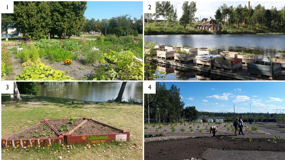
Kuva 2. Tutkimuksen neljä tamperelaista tapausta. (1) Hatanpään kaupunkiviljelmä, elokuu 2015. (2) Hiedanrannan kelluva puutarha, elokuu 2016, © Hanna Kirmanen. (3) Haist' Kukkanen viljelylaatikko, Sorsapuisto, heinäkuu 2014. (4) ARC-hanke/Hiedanrannan syötävä puisto, kesäkuu 2019.

Figure 2. Four Tampere-based cases from the study. (1) Hatanpää urban garden, August 2015. (2) Hiedanranta floating garden, August 2016, © Hanna Kirmanen. (3) Haist' Kukkanen gardening box, Sorsapuisto park, July 2014. (4) ARC project/Hiedanranta edible park, June 2019.