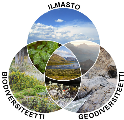
Kuva 1. Ilmasto, biodiversiteetti ja geodiversiteetti ovat kaikki osa luonnon monimuotoisuutta. Ne myös linkittyvät läheisesti toisiinsa. Englanninkielinen versio kuvasta on julkaistu Tukiainen ym. (2023) artikkelissa (CC BY 4.0).

Figure 1. Climate, biodiversity, and geodiversity are all part of natural diversity. They are also closely interconnected. An English version of the figure has been published in the article by Tukiainen et al. (2023) (CC BY 4.0).