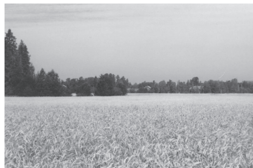
Kuva 3. Ruis lainehtii oletetulla Ulvilan keskiaikaisen kaupungin paikalla. Näkymä Siltatieeltä Isokartanolle ja kirkolle päin.

Uvilassa keskiajan jälkiä etsivän matkailijan on tiedettävä, mitä hakea. Maamerkkejä ovat Kokemäenjoen nykyinen uoma, Liikistö, kirkko, Isokartanon kokonaisuus ja Kellarinmäki. Keskiaikaisen kaupungin paikka on peltoaukealla asutuksen ja teiden välissä (Viertiö 2000: 10). Alue on hankalasti lähestyttävä esimerkiksi paikkakuntaa esittelevien oppaiden kannalta. He kokevat keskiaikaisen Ulvilan havainnollistamisen vaikeaksi, sillä kaupungin paikkaa on esiteltävä pellon reunalla viittoillen, ja Liikistön parkkipaikalle ei pääse matkailijaryhmien käyttämällä linja-autoilla (ks. kuva 3) (Ruohomäki 2006).