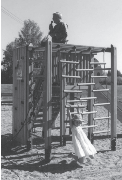
Kuva 2. Kaupunginjohtaja avaa Hansamarkkinat Ulvilassa 5.8.2006.

Picture 2. The Mayor of Ulvila opens the medieval market festival in Ulvila.