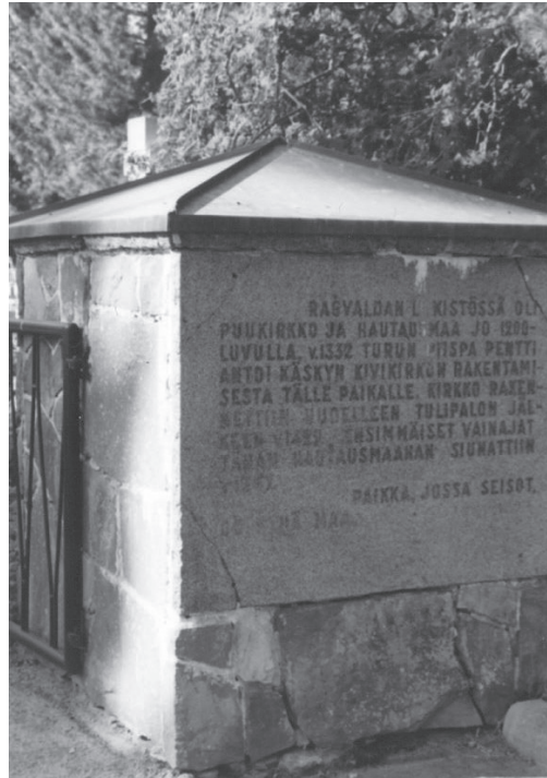
Kuva 4. ”V. 1332 Turun piispa Pentti antoi käsken kivikirkon rakentamisesta tälle paikalle.” Iikka Kronqvistin Ulvilan kirkolle antama ajoitus hakattiin kiveen ja kiinnitettiin Ulvilan kirkon portinpylväisiin vuonna 1958, Porin 400-vuotisjuhlan yhteydessä.

Keskiaikaisten kirkkojen tutkimus on ollut täynnä yllätyksiä, ja tulevaisuus näyttää yhtä valoisalta. (Mäkinen 2004: 37)