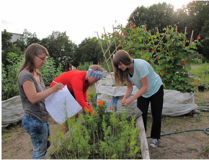
Kuva 3. Viljelykierron suunnittelua ja yrttipenkin kitkentää elokuussa 2015. Figure 3. Planning the crop rotation and weeding herbs in August 2015.