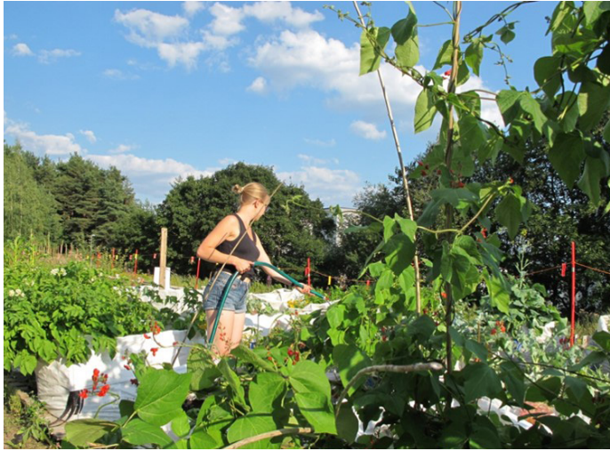
Kuva 2. Kastelua Kalevanharjun yhteisöviljelmällä elokuussa 2014. Figure 2. Watering the plantation at Kalevanharju community garden in August 2014.

Yhdessä toimiminen ja toisiin viljelijöihin tutustuminen muodostavat kaupunkiviljelytoiminnan ympärille yhteisön, mikä herättää viljelijöissä yhteenkuuluvaisuuden tunteen. Tämä tunne yhdistää viljelijäjoukkoa ja toisaalta erottaa heitä suhteessa muihin kaupunkilaisiin. Pouriasin ynnä muiden (2015: 123) mukaan tämä yhteisöön kuulumisen tunne ( feeling of belonging to a community ) on keskeinen viljelyn motivaatio myös pariisilaisilla yhteisöviljelmillä. Muutama Kalevanharjun viljelijöistä on ollut mukana myös toisessa kaupunkiviljelyprojektissa Tampereella, mikä luo verkostomaisia yhteyksiä kaupunkiviljelijöiden välille, ja muodostaa laajempaa kaupunkiviljelijöiden yhteisöä.