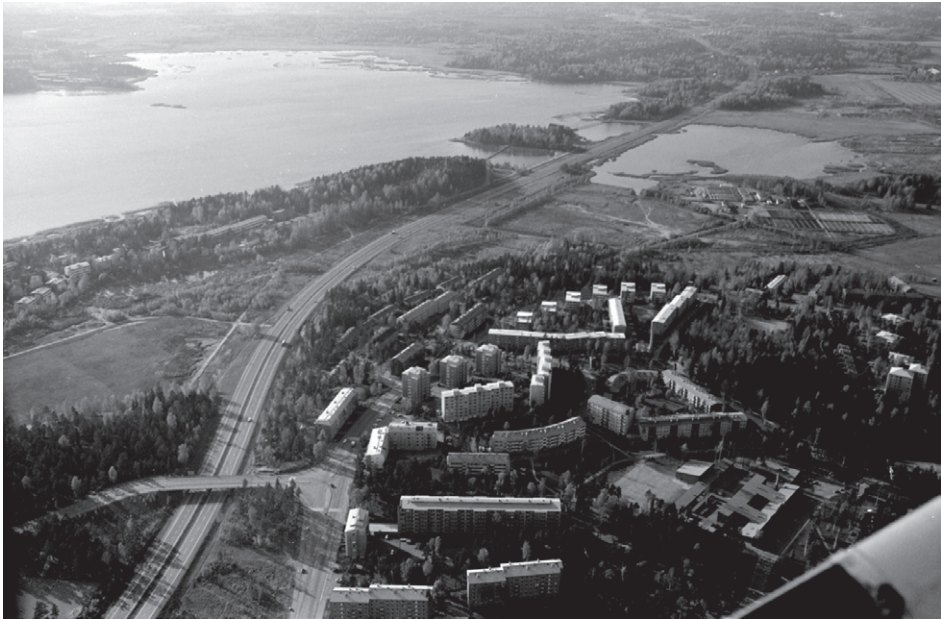
Kuva 4. Laajalahti ja Iso-Huopalahti vuonna 1970. Laajalahden ruovikkoiset rannat näkyvät vasemmassa ylä-laidassa, Iso-Huopalahden kaatopaikka näkyy kuvan oikeassa reunassa. Laajalahti and Iso-Huopalahti in 1970. (Helsingin kaupunginmuseo, kuvaaja Simo Rista; ser093306; Helsinki City Museum, photograph by Simo Rista).

Figure 4. The reedy shore of Laajalahti bay is visible on the upper left-hand corner and the sanitary landfill site at Iso-Huopalahti is visible on the right-hand side.