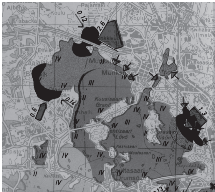
Kuva 3. Laajalahden ja Seurasaaresselkien vedenlaatu 1967. Kartan nuolet ilmaisevat jäteveden laskupaikan ja virtaaman. Roomalaiset numerot I–VI ilmaisevat vedenlaadun ja käyttötarkoituksen: I = vesijohtoveden hankinta, II = uiminen, III = kalastus, IV = virkistystoiminta ja asutus, V = satamatoiminta ja vesiliikenne, VI = jäteveden johtaminen vesistöön. (HKA, Jätevesikomitea 1969, Liite 3)

Figure 3. Water quality at Laajalahti bay and Seurasaaresselkien bay in 1967. Arrows show sewage outlets and their outflow. The roman numerals I–VI indicate the local water quality and suitable use: I = suitable for drinking water, II = swimming, III = fishing, IV = recreation and household use, V = harbor and water transport, VI = sewage outlet.